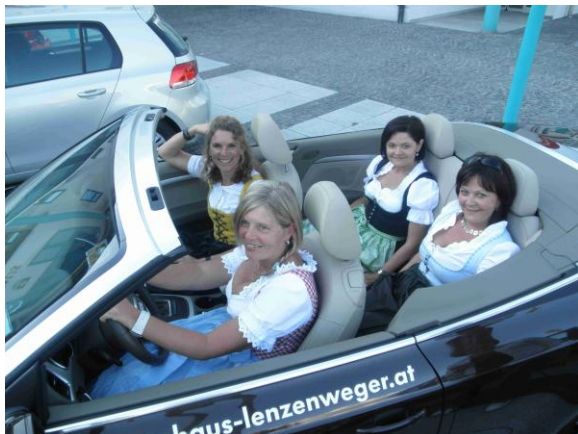
Das flotte Team der Gesunden Gemeinde im Cabrio

Während der Autoschau und nach dem Vortrag sorgte das Team der Gesunden Gemeinde Seewalchen mit gesunden Drinks und Snacks, sowie den „Herzal-Weckerln“ für die Bewirtung.