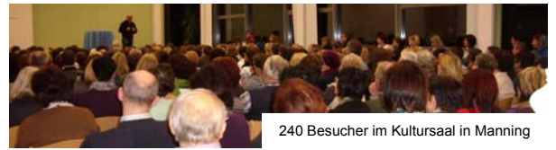
240 Besucher im Kultursaal in Manning