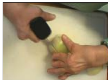
Polyarthritis: Die chronische Polyarthritis führt zu Gelenkschädigung und Funktionseinschränkungen, was durch Früherkennung und Frühbehandlung verhindert werden muss.