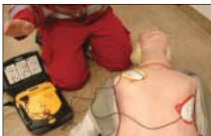
380 „Defis“ stehen in ganz Oö. als Waffe gegen den Herztod bereit.

Die gute Nachricht: für viele Opfer steigt künftig die Überlebenschance. An 380, übers ganze Land verstreuten Plätzen, stehen in Oberösterreich nun schon Laiendefibrillatoren, kurz „Defi“ genannt, als lebensrettende Waffe gegen den Herztod bereit. Eingesetzt durch einen ausgebildeten Ersthelfer verzehnfacht sich die Überlebensrate nach einem Kreislaufstillstand. Denn selbst in rettungsdienstlich optimal angeordneten Regionen erreicht kaum ein Notarzt oder Sanitäter innerhalb der „magischen“ 3 Minuten, in welchen das Gehirn ohne Sauerstoff bleiben kann, den Einsatzort. Mit dem Defi kann diese Zeit überbrückt werden und der oft lebensrettende Elektroschock frühzeitig auch durch Laienhelfer verabreicht werden.