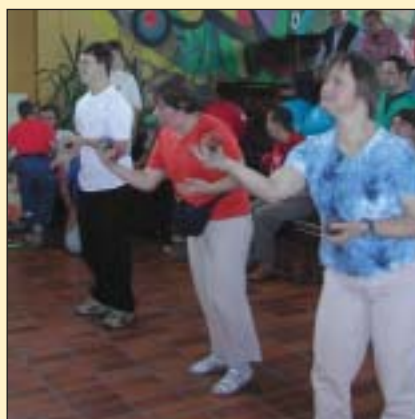
Besuch der Sportgruppe von St. Pius beim 2. Gesundheitstag in Neukirchen