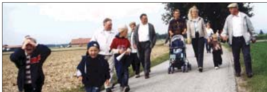
Gemeindegwandertag mit Schatzsuche, September 2003

Gesundheit: In Burgkirchen wurde der „Gesunde-Gemeinde-Aktiv-Pass“ eingeführt. Für jede besuchte Veranstaltung, Kurs, Vortrag usw. erhält der Besucher einen Stempel in den Pass. Wer 10 Eintragungen erreicht hat, erhält zur Anerkennung für sein aktives Gesundheitsbewusstsein einen Vitalkorb, welcher mit regionalen Schmankekn von Vollkornbrot bis Honig und