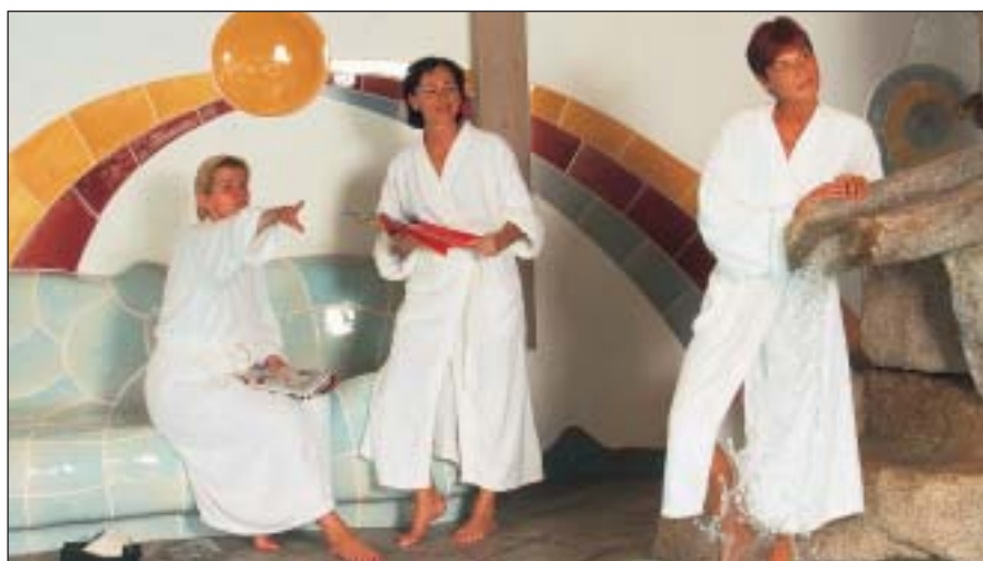
Tourismus in Verbindung mit Gesundheit und Wellness hat in Oberösterreich einen hohen Stellenwert

In der Kooperation der „Oö. Gesundheits-Partner“ sind die 6 Top-Gesundheitsanbieter Oberösterreichs vertreten. Es sind dies jeweils Tourismusverband & touristischer Leitbetrieb aus Bad Hall, Bad Schallerbach, Bad Ischl, Bad Zell, Bad Leonfelden und Geinberg.