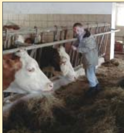
Faszination im Stall