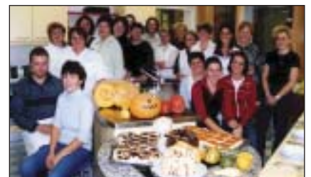
„Kürbis“-Kochkurs in der Haushaltungsschule Burgkirchen

Bewegung: Das bereits bestehende Angebot an Sportmöglichkeiten wurde erweitert mit Wirbelsäulengymnastik