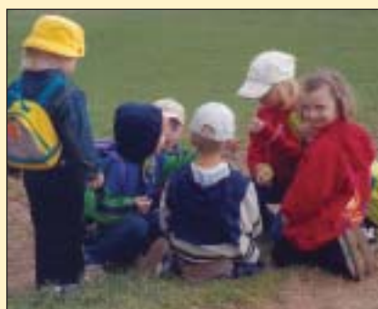
Wie schmeckt Löwenzahn