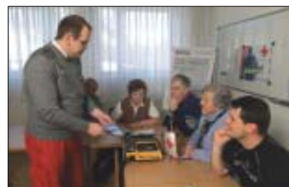
Möglichst viele Bürger/innen sollten sich als Ersthelfer ausbilden lassen.

Andererseits ist auch die Ausbildung von möglichst vielen Gemeindegürgern in Erster Hilfe ein wesentlicher Erfolgsfaktor. Der Umgang mit dem Defi ist Bestandteil in den 16-stündigen Ersthilfe-Grundkursen, welche allen Interessierten offen stehen und von allen Rotkreuzstellen veranstaltet werden. Auch eigene Kurse für Firmen, Vereine oder Institutionen können flexibel vereinbart werden. Es gilt: Je mehr ausgebildete Ersthelfer, desto höher die Chance zum Überleben. Denn auch die beste Waffe gegen den Herztod bleibt wirkungslos, wenn keiner sich zutraut, sie zu bedienen. Das Netz der Hilfe kann durch Engagement und Vorbild der Gemeinden dicht geknüpft werden - und alle profitieren davon.