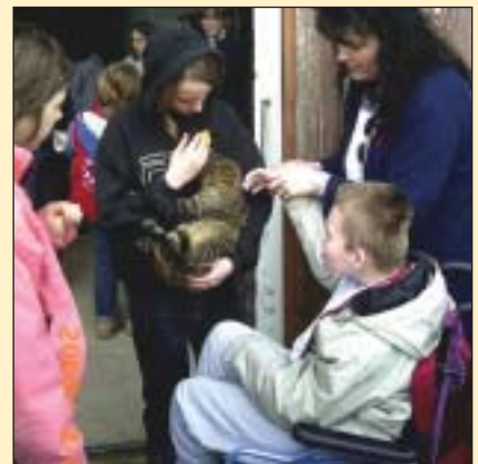
Behinderte am Bauernhof Obernhumer