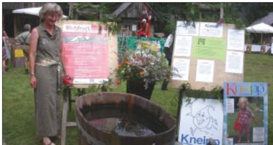
Infostand zum Thema Kneipp

Im Rahmen dieses Schwerpunktes entstand auch die erste Nordic Walking Gruppe in Gosau. Um einen positiven Trainingseffekt zu erhalten, wurden gleich 10 Einheiten zu je 120 Minuten angeboten. Selbstverständlich wurde auch wieder gekocht. In diesem Jahr standen Kräuter und Gemüse auf dem Speiseplan, damit vor allem weniger gesalzen dafür mehr gewürzt wird.