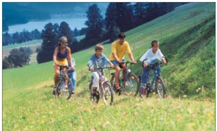
Mit sportlicher Betätigung an der frischen Luft leistet man einen wichtigen Beitrag zur Gesundheit