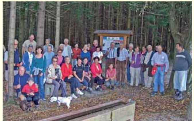
In Lengau wird jede Woche gewandert

Wandern hat im Bezirk Braunau Tradition. Es gibt viele Gesunde Gemeinden, die teilweise wöchentliche oder monatliche Wanderungen organisieren. Führend ist hier