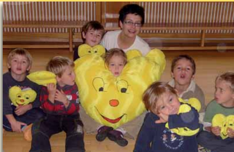
Herzigus im Kindergarten Buchkirchen, Herbst 2009