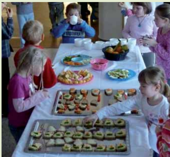
Die Zusammenarbeit von Eltern, Schule, Lichtenberger Bäuerinnen und Nahversorger garantiert eine bunte regionale Pausenvielfalt.

Jeden Mittwoch, wenn um 09:45 die Schulglocke läutet, stürmen die Schülerinnen und Schüler der Volksschule Lichtenberg voller Erwartung in die Aula, um sich am „Gesunde Jause Büffet“ zu laben.