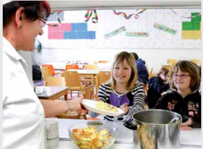
Ein Lob aus einem Kindermund wie „Danke, das hat gut geschmeckt!“ ist die größte Auszeichnung für die Köchin.

Für ein Lob aus einem Kindermund wie „Danke, das hat gut geschmeckt!“ macht sie beinahe alles, verrät die Köchin. Das ist die größte Auszeichnung für sie!