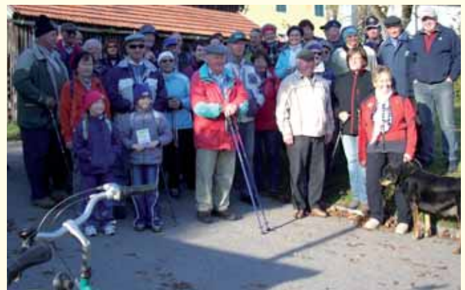
Bezirkswanderung in Perwang

Lengau. In dieser Gemeinde gibt es vier Wandergruppen und zwar montags für Senioren – abwechselnd in Friedburg und in Schneegattern – mittwochs eine „Langsam-Gruppe“ für Senioren mit maximal ein- bis eineinhalbstündigen Wanderungen, samstags für Berufstätige und Menschen, welche während der Woche keine Zeit haben.