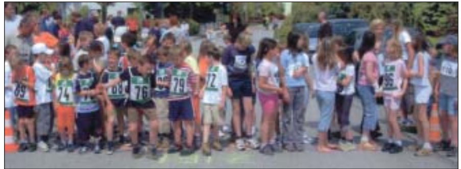
„Kinder-Brezellauf“ beim Gesundheitstag