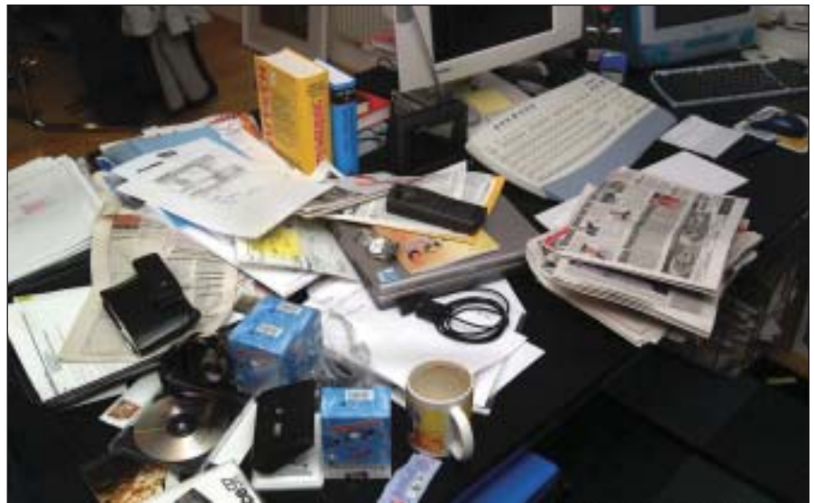
Schreibtischchaos und Desorganisation behindern - Ordnung bedeutet Zeitgewinn

Zeit haben und Nein sagen gehören zusammen. Tatsächlich scheint es so, dass jeder von uns immer wieder sehr sorglos mit seiner Zeit umgeht, andererseits nicht genügend Zeit für die Dinge zu haben vermeint, die ihm wirklich am Herzen liegen. Unwichtige Dinge, zeitraubende Tätigkeiten ohne essenziellen Wert, ineffektives Arbeiten, ungeplantes Tun, Schreibtischchaos, Desorganisation, aber auch unangebrachte Forderungen von Mitmenschen sorgen in schöner Regelmäßigkeit dafür, dass uns wichtige Zeit abhanden kommt.