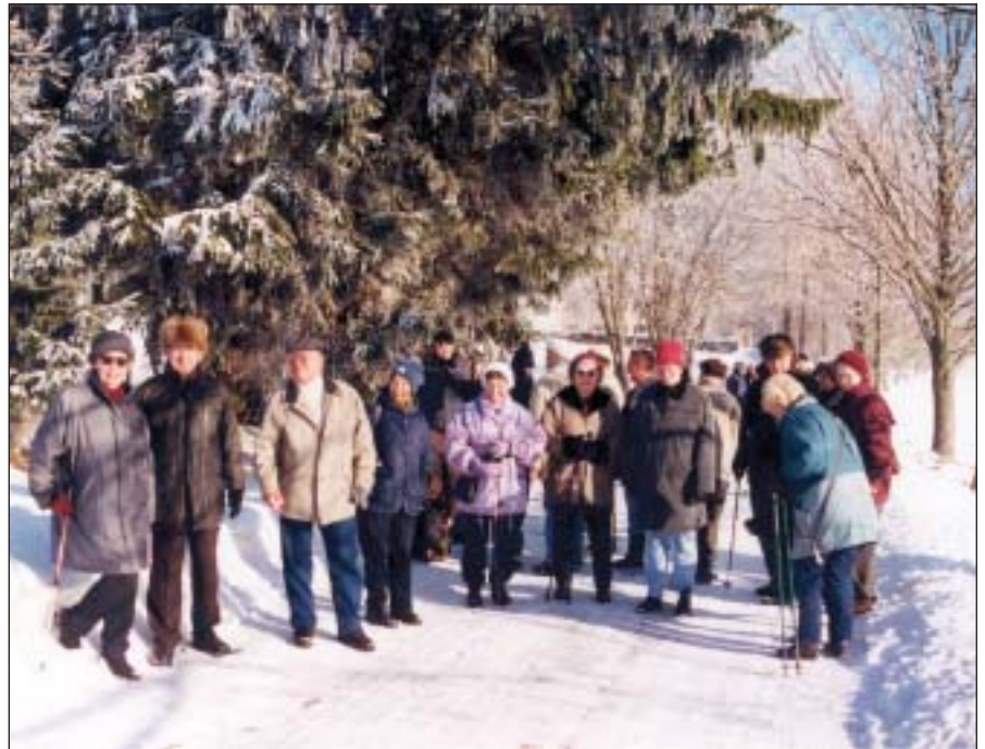
Auch im Winter trifft sich die Selbsthilfegruppe zum geselligen Austausch

Verbandsabende mit Fachvorträgen, aber auch Großveranstaltungen wie Herztage oder Herzseminare mit namhaften Persönlichkeiten aus der Ärzteschaft werden abgehalten.