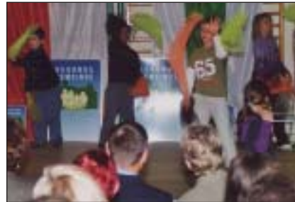
Bewegte Schule - Jonglierende Schülerinnen und Schüler