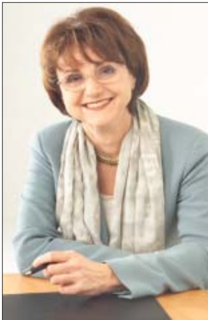
Landesrätin Dr. Silvia Stöger appelliert, die Gefahren scheinbar harmloser Infektionskrankheiten nicht zu unterschätzen und rät eindringlich zu Schutzimpfungen.

„Impfungen sind eine der effektivsten Maßnahmen der Vorsorgemedizin. Eine hohe Durchimpfungsrate schützt nicht nur den einzelnen Geimpften, sondern die gesamte Bevölkerung durch Unterbrechung der Infektionsketten. So können auch jene geschützt werden, die nicht geimpft sind.“